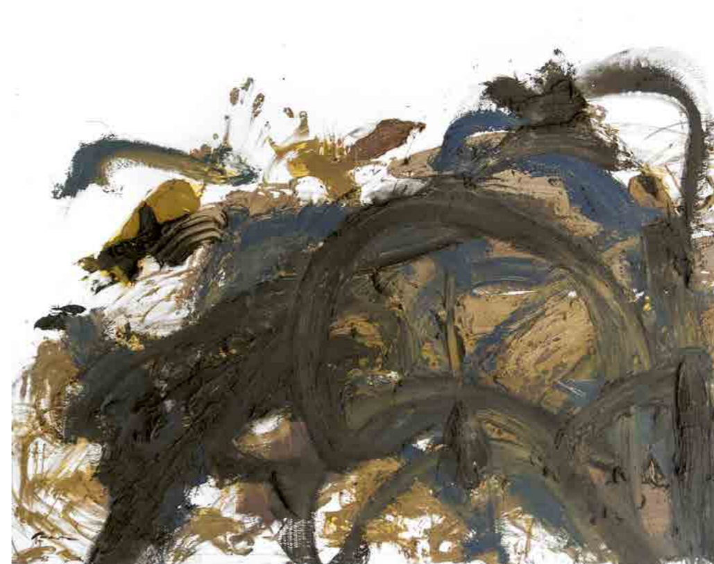
Pintura 1078, 160x130 cms, oli sobre tela