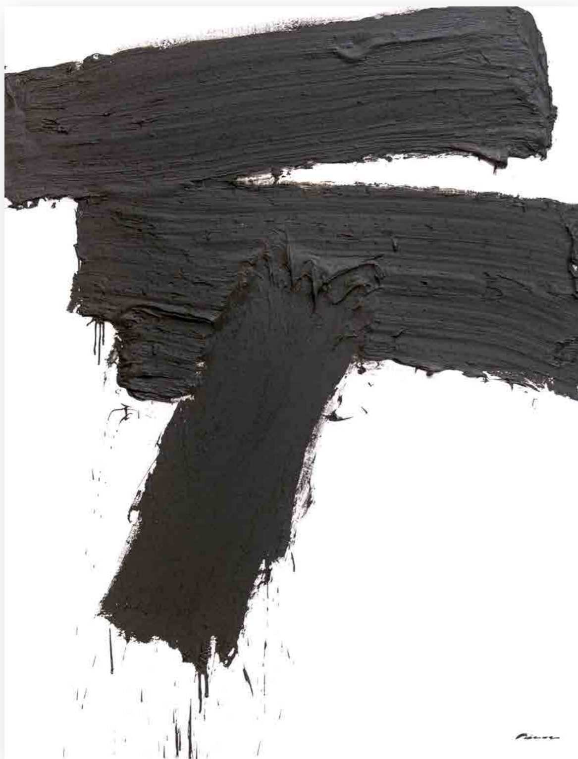
Pintura 2207, 160x122 cms, oli sobre tabla