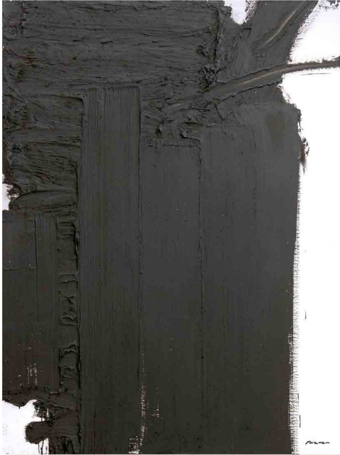
Pintura 2208, 160x122 cms, oli sobre tabla