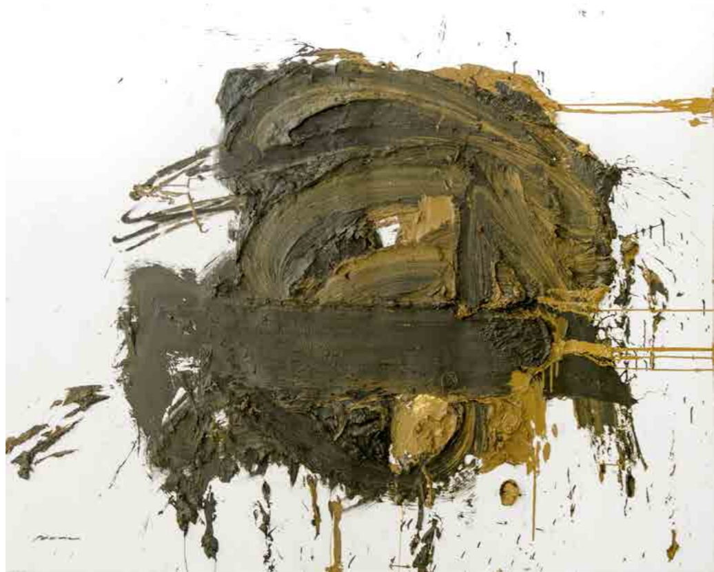
Pintura 1143, 160x130 cms, oli sobre tela