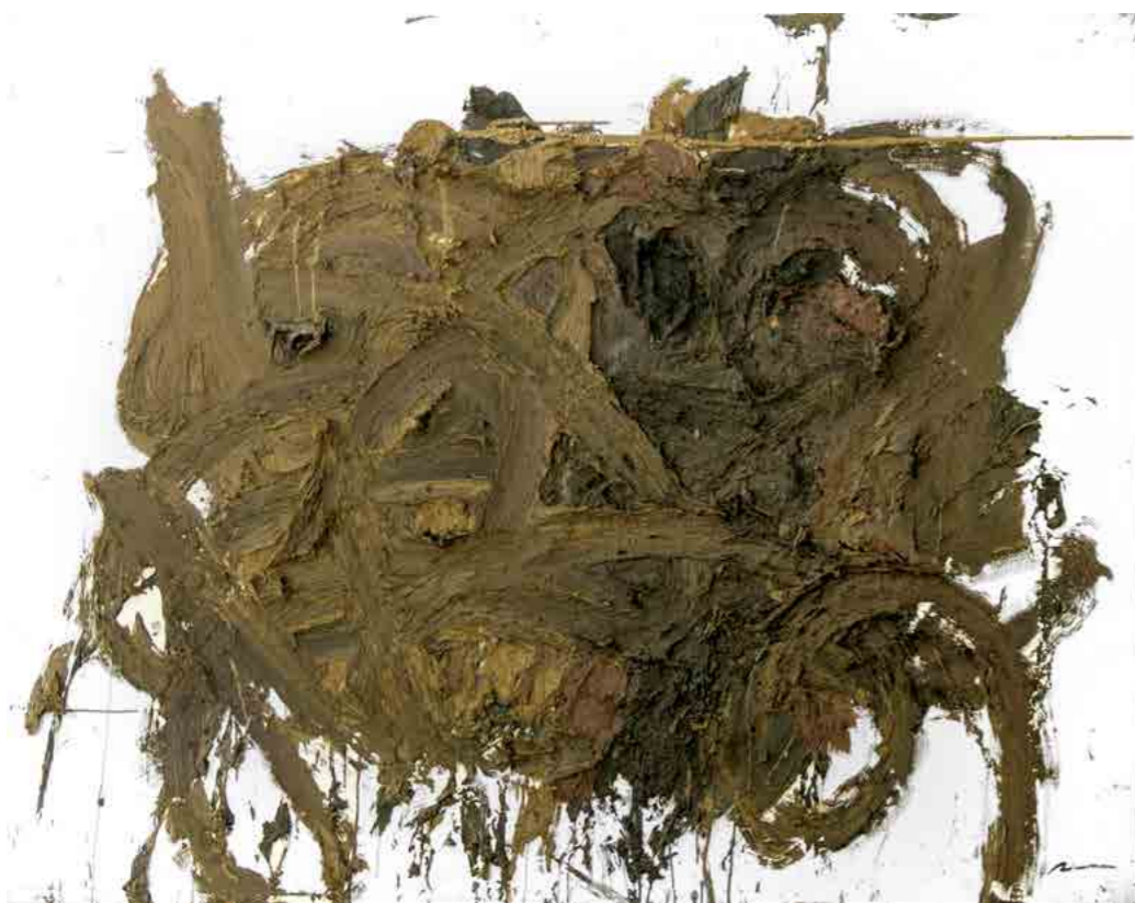
Pintura 1146 , 160x130 cms, oli sobre tela