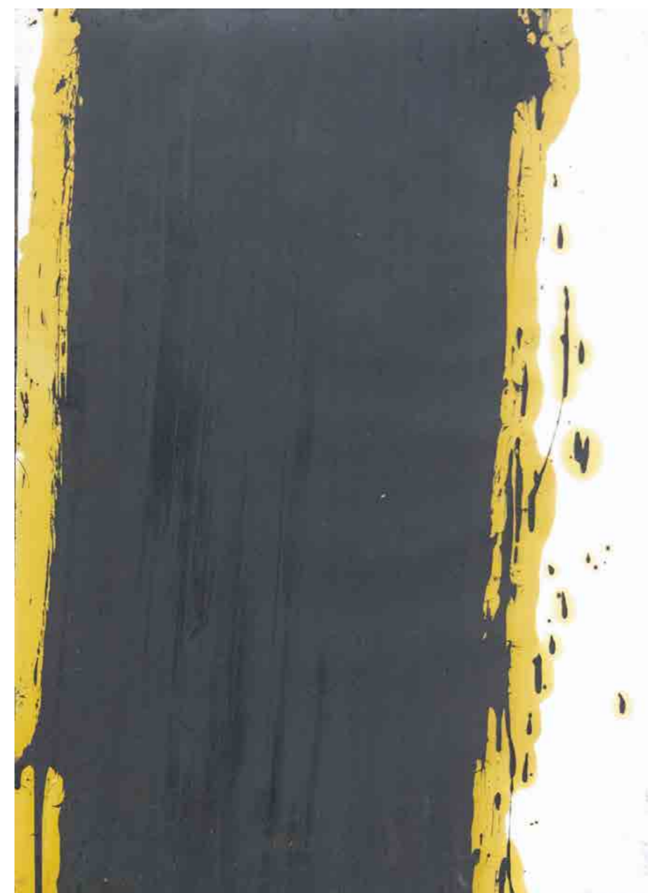
Pintura 2155, 70x50 cms, oli sobre paper