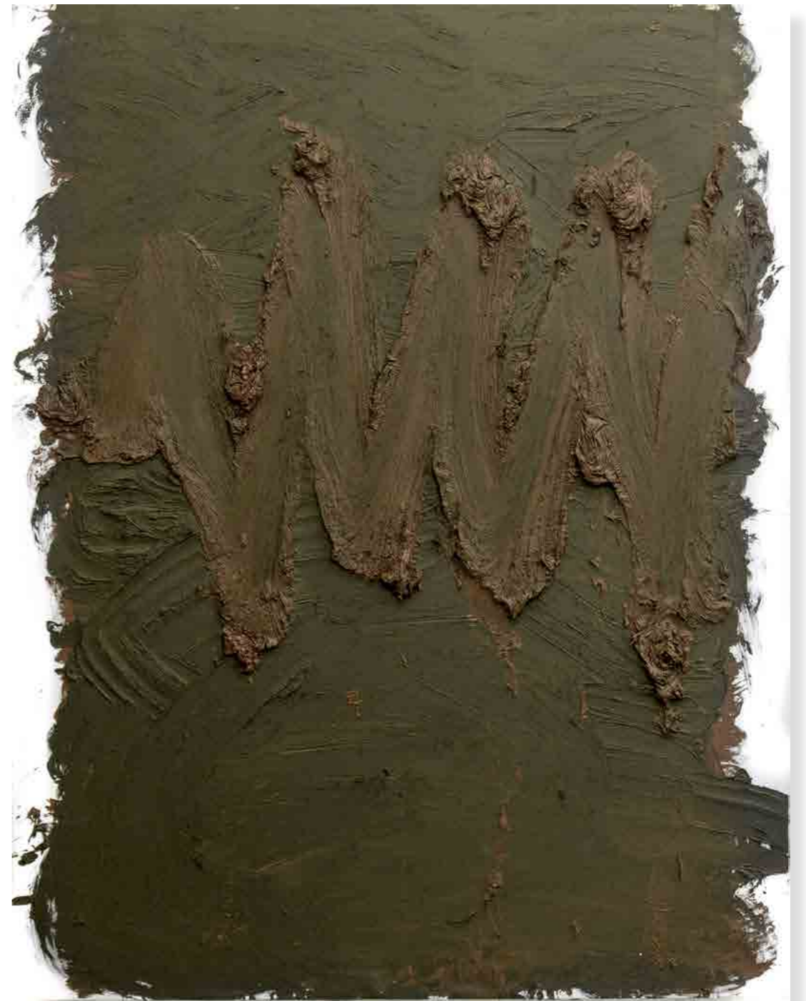
Pintura 1123, 160x130 cms, oli sobre tela