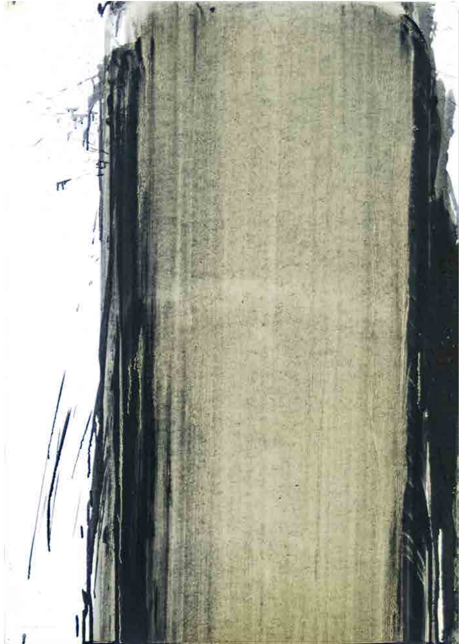
Pintura 2164, 70x50 cms, oli sobre paper