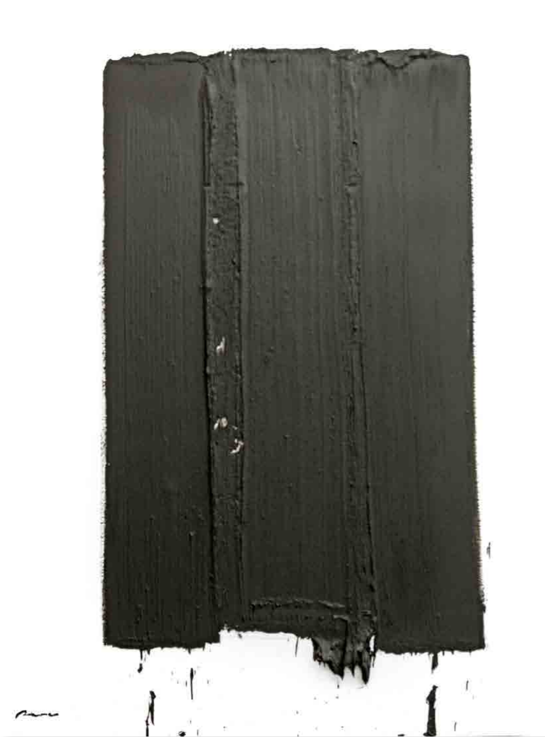
Pintura 2228, 160x122 cms, oli sobre tabla