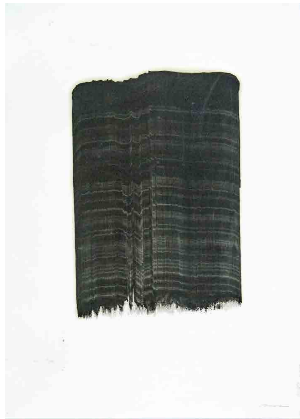
Pintura 2189, 70x50 cms, oli sobre paper