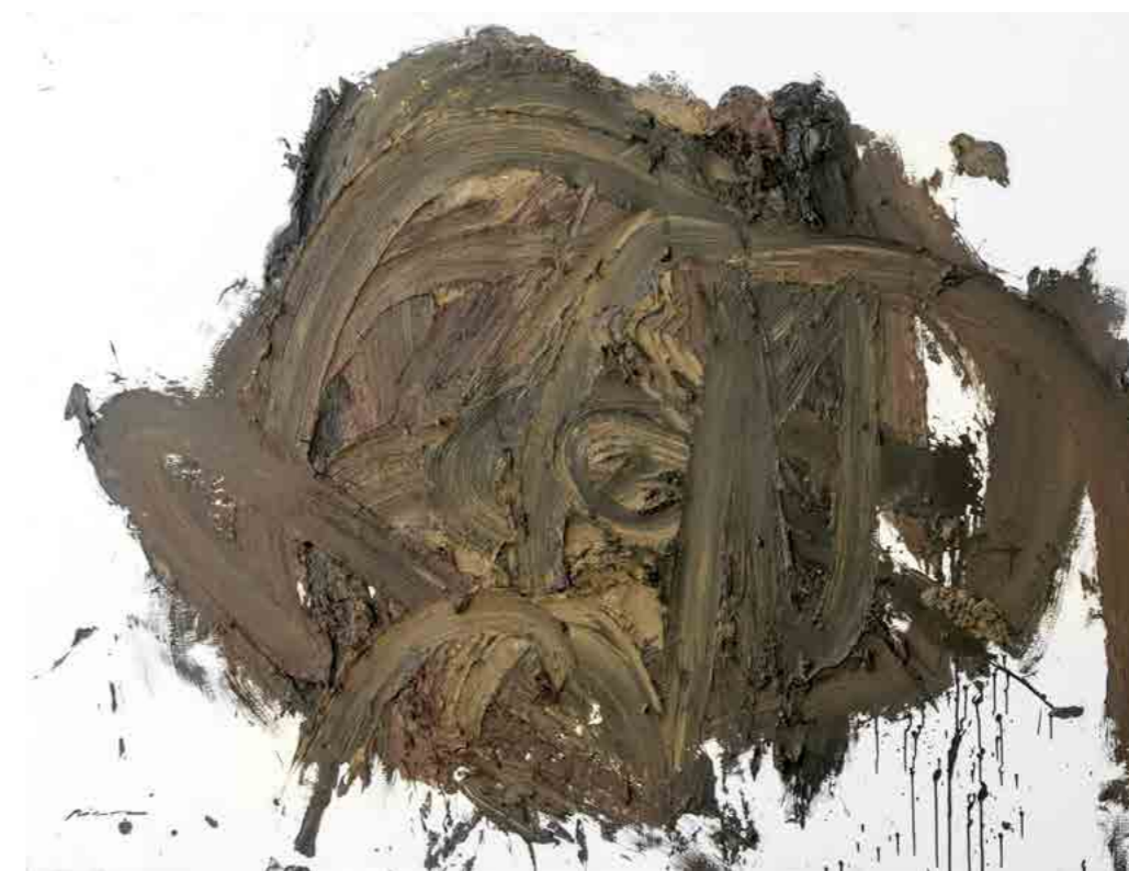
Pintura 1147, 160x130 cms, oli sobre tabla