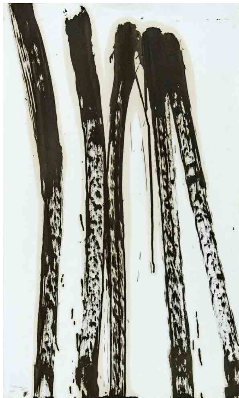
Pintura 1150, 70x50 cms, oli sobre paper