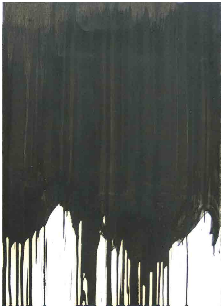
Pintura 2177, 70x50 cms, oli sobre paper