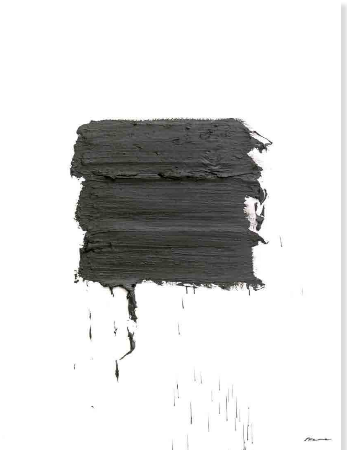
Pintura 2215, 160x122 cms, oli sobre tabla