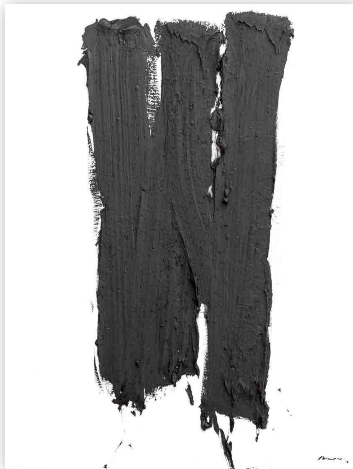
Pintura 2206, 160x122 cms, oli sobre tabla