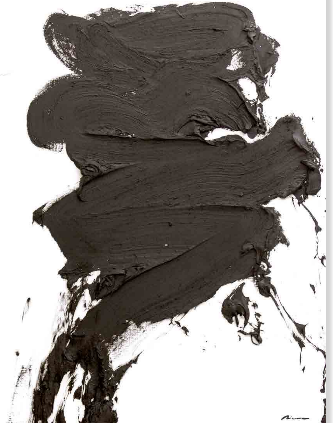
Pintura 2205, 160x122 cms, oli sobre tabla